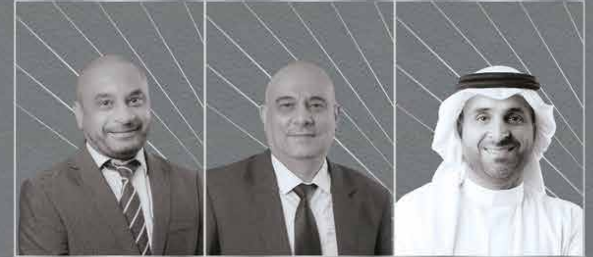
وصيف أصغر مدير تنفيذي - مدير إدارة الاستثمار