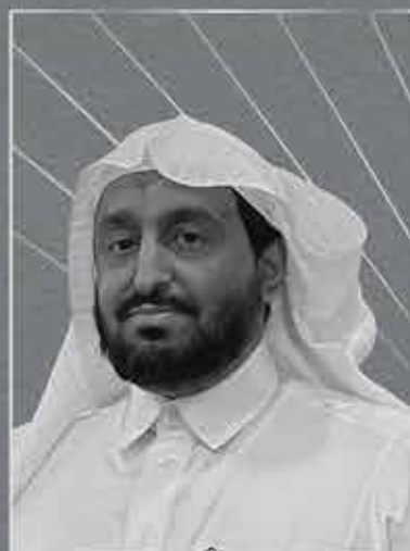
الشيخ الدكتور/ عبد المحسن بن زايد المسعود عضو الهيئة الشرعية