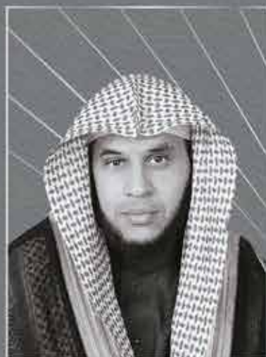
الشيخ الدكتور/ جميل بن عبد المحسن الخلف عضو الهيئة الشرعية