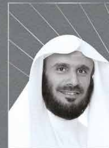
الشيخ الدكتور / يوسف بن عبدالله الشبلي عضو الهيئة الشرعية