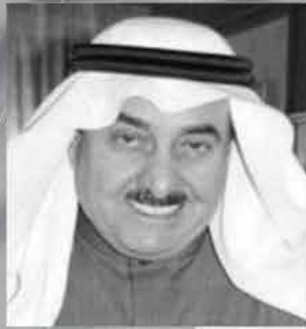
الشيخ عبد الله بن رشيد الرشيد